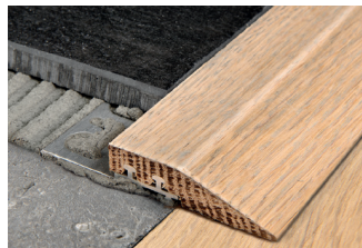
ROVERE NATURALE con BASE IN ALLUMINIO lungh. barre 1,35 ml - conf. 20 PZ - 27 ml