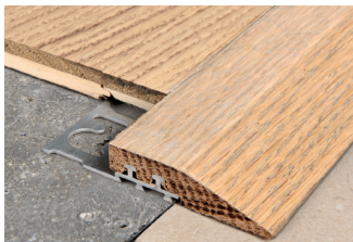
ROVERE NATURALE con BASE IN ALLUMINIO lungh. barre 2,7 ml - conf. 10 PZ - 27 ml

PROSLIDER WOOD è un profilo con supporto in alluminio e superficie a vista in rovere che consente di raccordare in modo continuo e senza gradini una pavimentazione in sovrapposizione ad una esistente e di proteggere i bordi del pavimento, munito di aletta traforata che ne garantisce l'aggancio sotto la piastrella. PROSLIDER WOOD in alluminio naturale e rovere è idoneo per qualsiasi ambiente dove è richiesta eleganza e una buona resistenza meccanica.